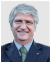
Mohammed Ben Sulayem, FIA President

A motorkerékpározás a rajongók és a gyűjtők számára egyaránt jelentős történelmi és technológiai érdekességgel bíró szegmens. A motoros örökség gazdasági és társadalmi hatása felbecsülhetetlen, és védendő. Történelmünk darabjait meg kell őrizni és a megőrzés szabályait jogszabályi keretekbe foglalni.