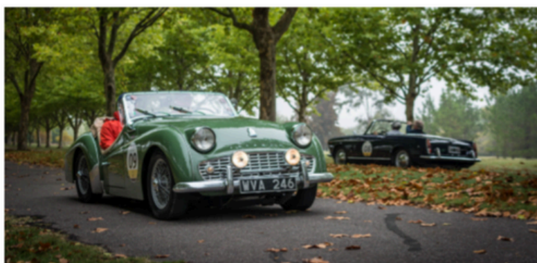
A történelmi járművek minimális környezeti hatással bírnak. Kibocsátásuk a teljes járműpark kibocsátásának elenyésző töredéke, alkatrészeik jól megőrzöttek és újrahasznosítottak.