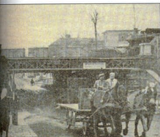
Újsághír: 28 méter széles lesz az új, Dózsa György úti aluljáró

A hatalom nem „szerette” a klubot, a nemzetközi kapcsolatait sem nézte jó szemmel, így ezt a korábbiakban eredményes területet is fokozatosan fel kellett adni.