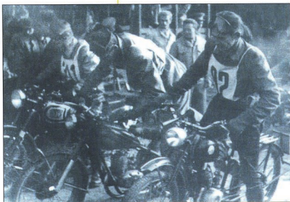
Terepverseny 1950. október 8-án